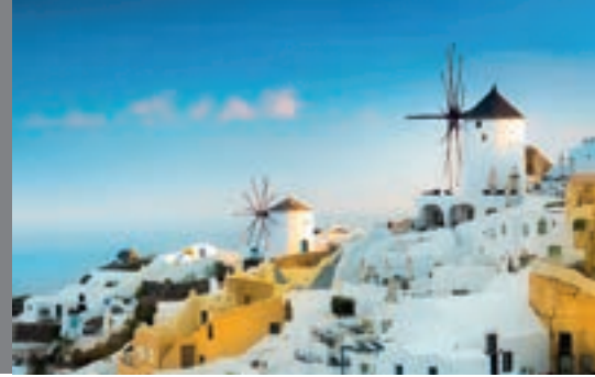
Griechenland schmecken im Dione Restaurant