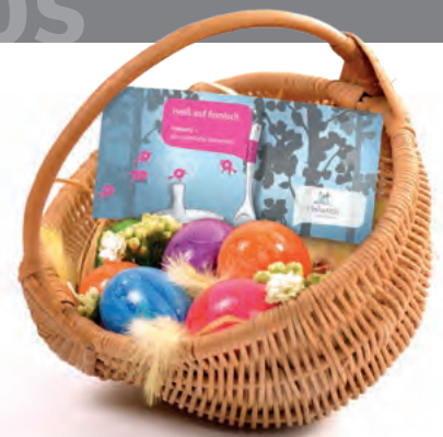
Das passende Geschenk fürs Osterkörbchen: ein Finlantis-Gutschein

Was wäre Ostern ohne ein Festmahl? Das Küchenteam der Finlounge serviert falscher Hase mit Petersilienkartoffeln und Leipziger Allerlei auf klassische Art. Zum Dessert gibt es Joghurt-Limetten-Creme mit einem Schuss Eierlikör. Um den Tag perfekt zu machen, gönnen Sie sich ein intensives Verwöhnprogramm. Bei vorheriger Reservierung kann man zum Beispiel eine Fin-Hydrating-Behandlung für geschmeidige Haut genießen. Im Anschluss gibt es eine kleine, schokoladene Osterüberraschung.