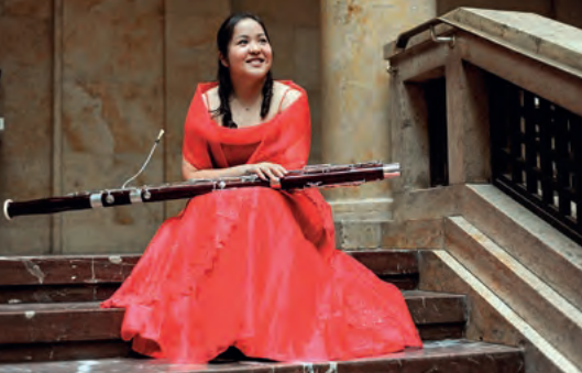
Die Fagottistin Rie Koyama