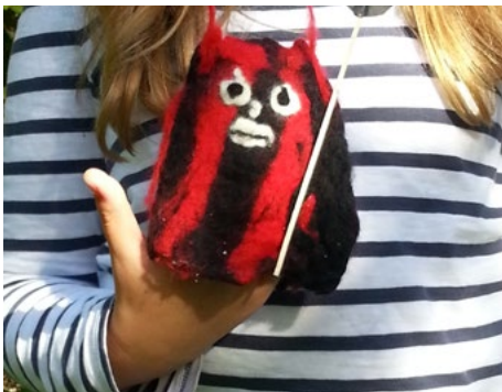
Im Kerzenschein Gespenster basteln.

Stadt, es sichert Arbeitsplätze und schont die Umwelt. Mit der Kampagne zum Energie-Euro treiben die Stadtwerke Nettetal seit längerem die lokale Wirtschaft an. Mit der Kampagne „Heimat shoppen“ möchten die Nettetaler Einzelhändler nun auf die Bedeutung eines starken Einzelhandels hinweisen. Geschäftsleute in allen Nettetaler Stadtteilen stehen am Freitag und Samstag, 11. und 12. September, Rede und Antwort – geshoppt werden darf natürlich auch.