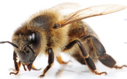
Imker treffen sich am 06.09. im NABU Naturschutzhof. Summ!