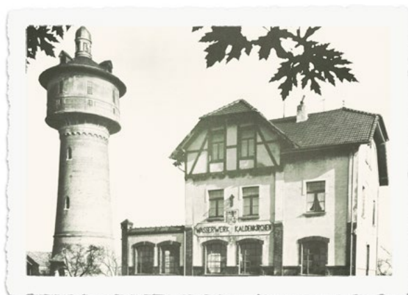
Das Wasserwerk Kaldenkirchen um die Jahrhundertwende.

neuen Konzessionsvertrag mit einer Laufzeit von 30 Jahren. „Wir freuen uns über das