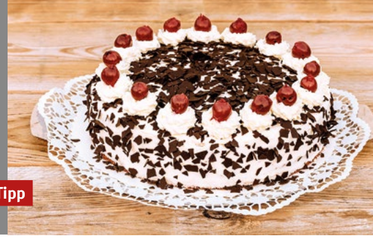
Bei Backwaren und Kuchen gibt es saftige Rabatte mit dem Energie-Euro.